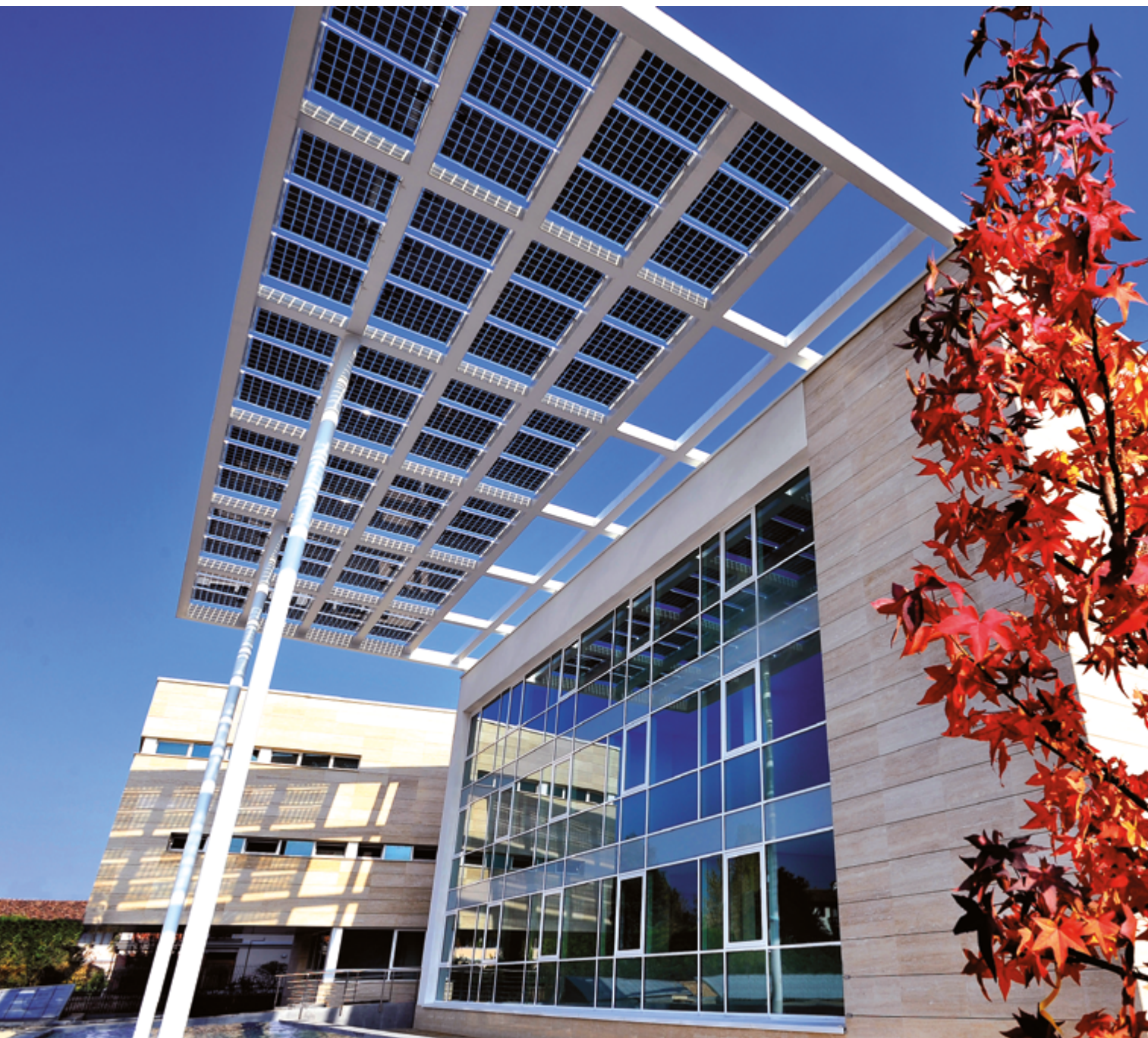
La sede della Polizia Locale inaugurata nel 1° Mandato di Alessandrini nel 2009