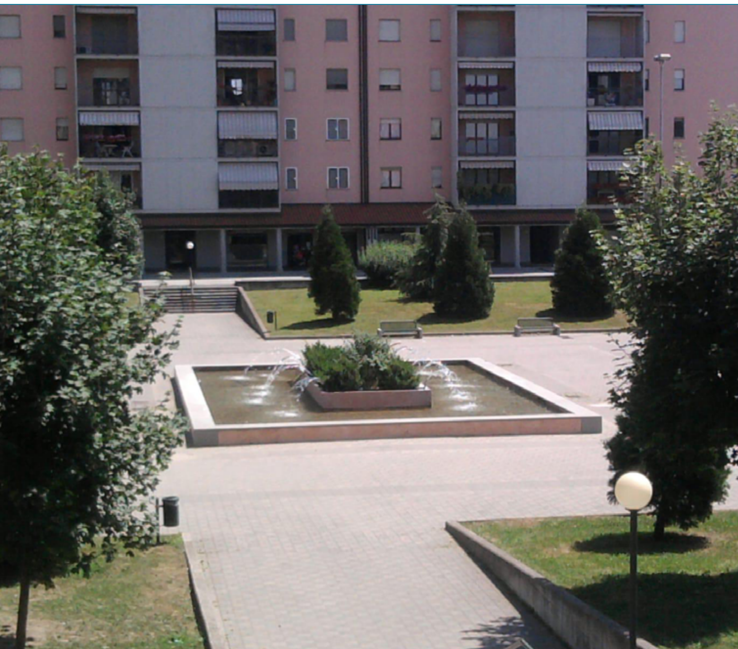
La fontana nella piazza di Lavanderie realizzata poco prima del 2010 insieme al parco e al monumento alle Torri Gemelle oggi in stato di completo abbandono