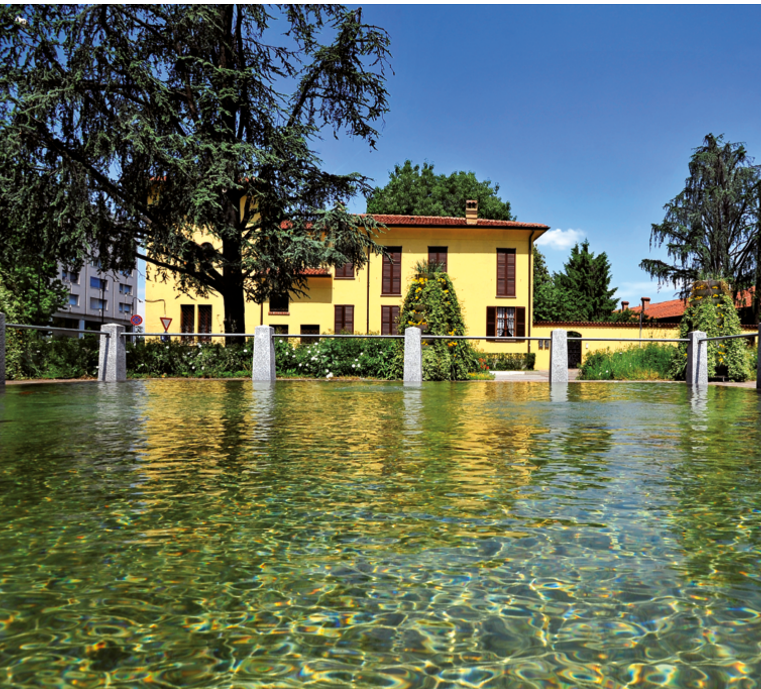
Il Funtanun di Segrate Centro come si presentava dopo la riqualifica e ora trascurato