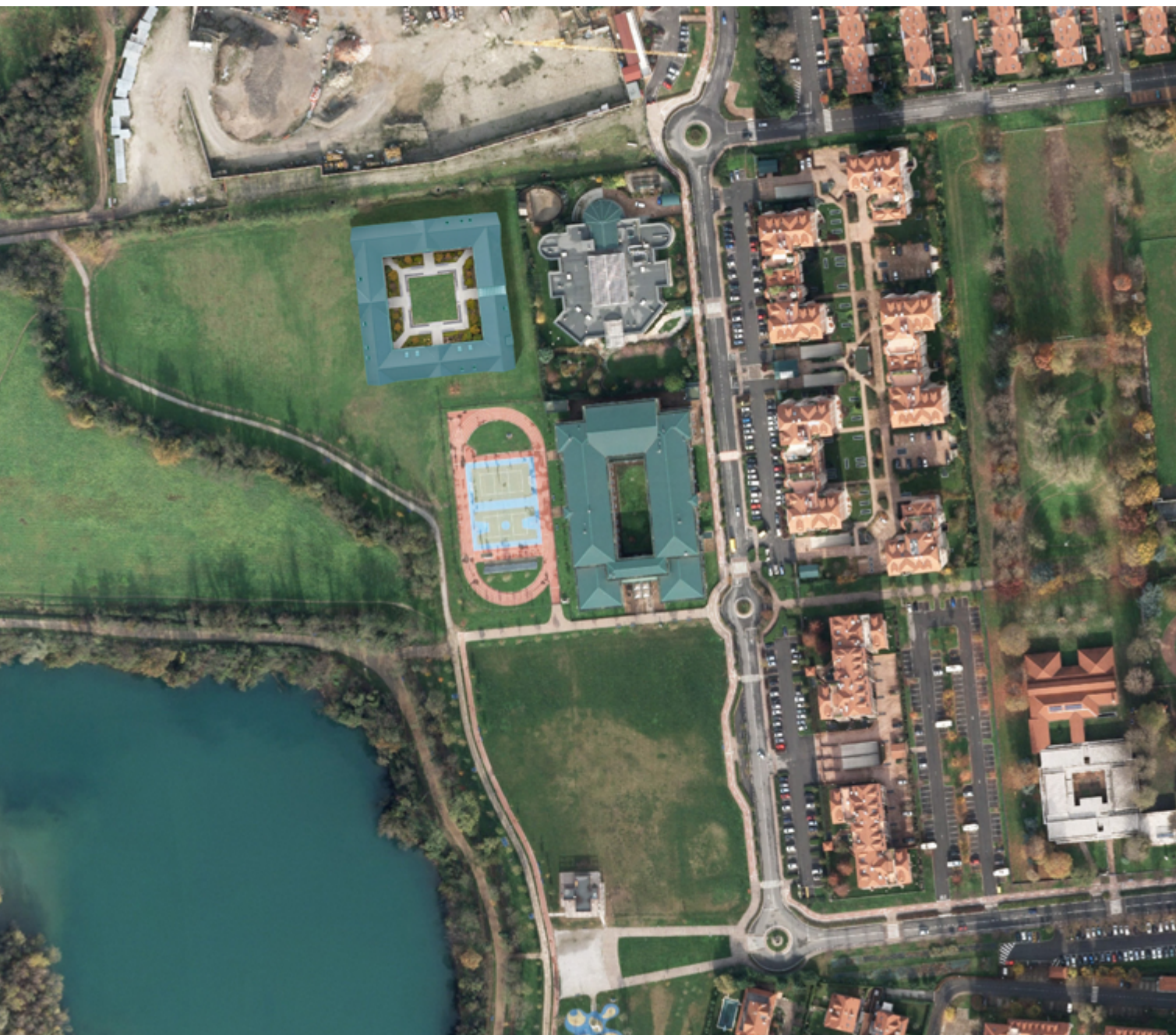
Idea di progetto per la nuova scuola elementare in Segrate Centro, di fianco alla media Leopardi